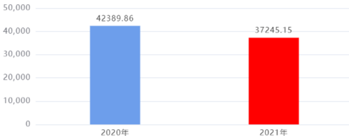
财政拨款收入、支出总计对比图（单位：万元）