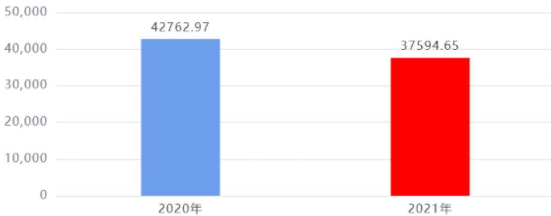
收入、支出决算总计对比图（单位：万元）

本年度收入、支出总计均为37,594.65万元，与上年相比减少5,168.32万元，下降12.09%，下降的主要原因是：本年度学校大型校建资金减少。